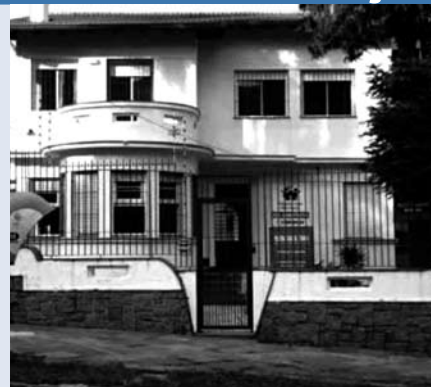
A Pequena Casa da sede Petrópolis, aluga salão de festas para eventos

As crianças da Pequena Casa agradecem sua colaboração.