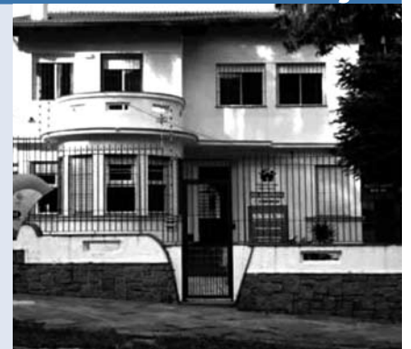
A Pequena Casa da sede Petrópolis, aluga salão de festas para eventos

As crianças da Pequena Casa agradecem sua colaboração.