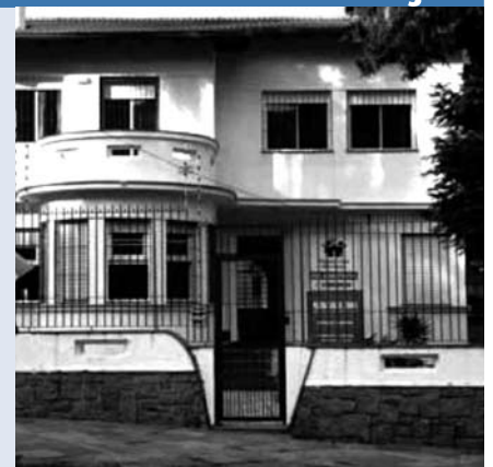
A Pequena Casa da Unidade Petrópolis aluga salão de festas para eventos

As crianças da Pequena Casa agradecem sua colaboração.