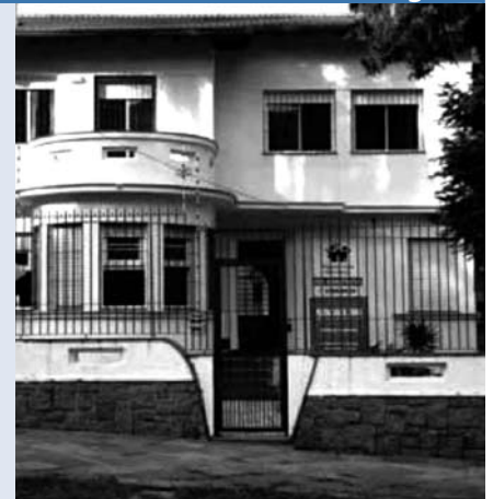
A Pequena Casa da Unidade Petrópolis aluga salão de festas para eventos

As crianças da Pequena Casa agradecem sua colaboração.