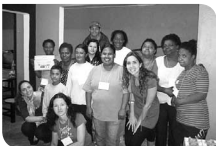
Turma da manhã

ram a importância dos alimentos para a saúde, bem como a forma correta de utilizá-los. Com uma carga horária de 20 horas, o curso foi uma parceria da Pequena Casa da Criança com a Fundação de Assistência Social e Cidadania (FASC). Todos os participantes receberam um certificado.