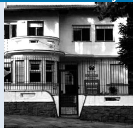
A Pequena Casa da Unidade Petrópolis aluga salão de festas para eventos

As crianças da Pequena Casa agradecem sua colaboração.