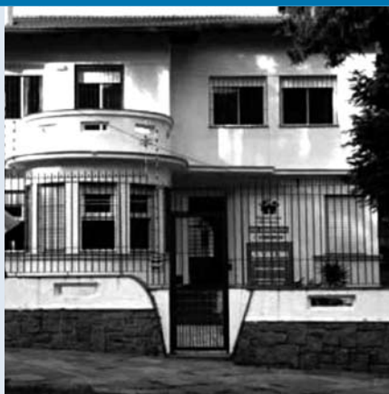
A Pequena Casa da Unidade Petrópolis aluga salão de festas para eventos

As crianças da Pequena Casa agradecem sua colaboração.