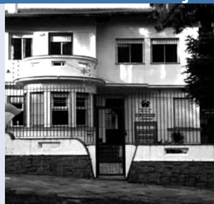
A Pequena Casa da Unidade Petrópolis aluga salão de festas para eventos

As crianças da Pequena Casa agradecem sua colaboração.