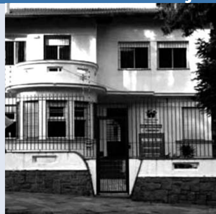
A Pequena Casa da Unidade Petrópolis aluga salão de festas para eventos

As crianças da Pequena Casa agradecem sua colaboração.