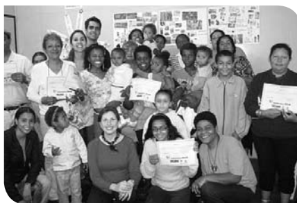
Turma da tarde