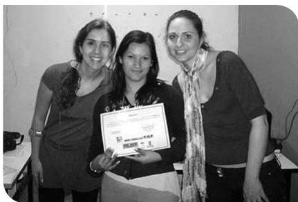
Entrega de certificados do curso “Educando para uma Alimentação Saudável”