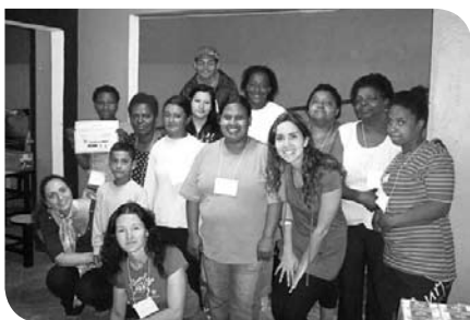
Turma da manhã

ram a importância dos alimentos para a saúde, bem como a forma correta de utilizá-los. Com uma carga horária de 20 horas, o curso foi uma parceria da Pequena Casa da Criança com a Fundação de Assistência Social e Cidadania (FASC). Todos os participantes receberam um certificado.