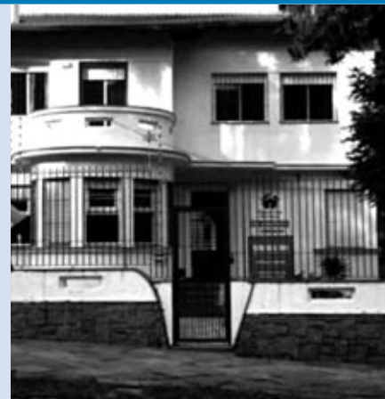
A Pequena Casa da Unidade Petrópolis aluga salão de festas para eventos

As crianças da Pequena Casa agradecem sua colaboração.